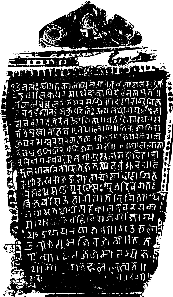
गुस्तल महाविहारया नै सं. ६३५ या महाकाल अभिलेख

अभिलेख ४ को छविचित्र (Fascimile) यसप्रकार छ ।